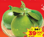
03 Bưởi hồng da xanh túi lưới