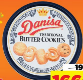
04 Bánh Danisa hộp thiếc 68lg