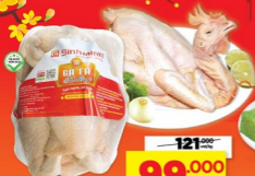
01 Gà ta Tứ Quý Bình Minh