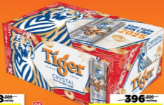
05 Thùng 24 lon bia Tiger Crystal 330ml